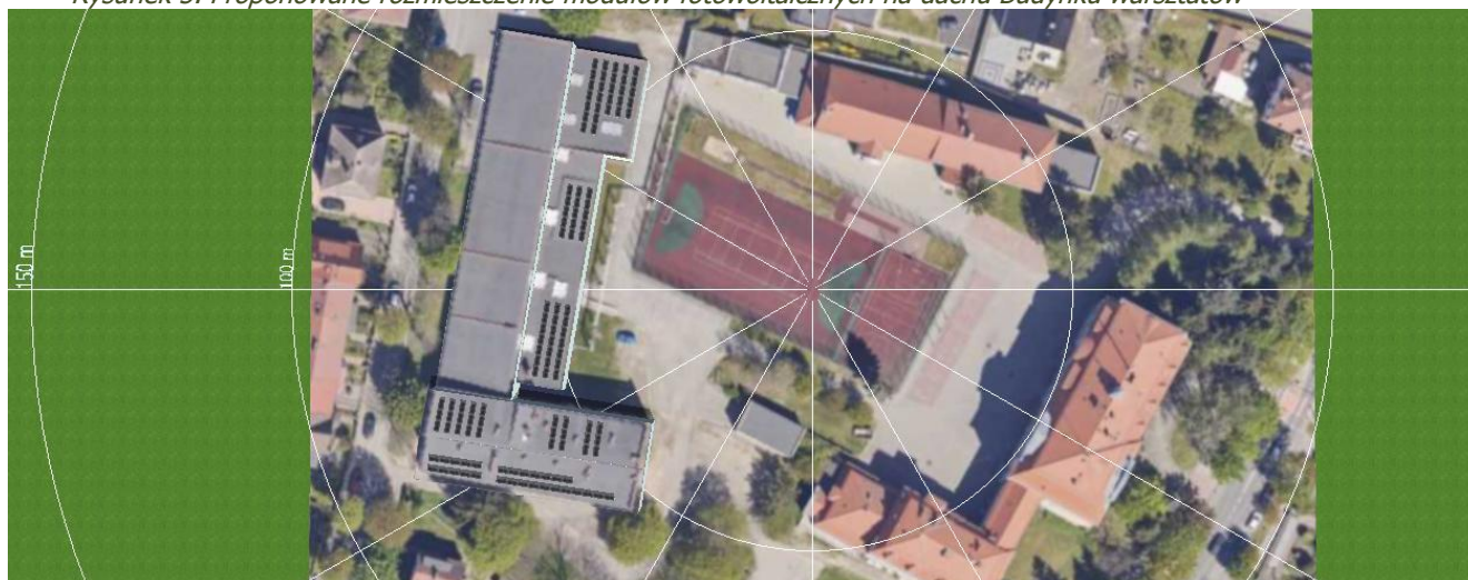
Rysunek 5. Proponowane rozmieszczenie modułów fotowoltaicznych na dachu Budynku warsztatów